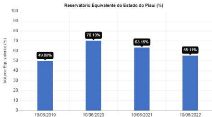
Figura 2. Evolução do volume dos reservatórios no Piauí em 10 de junho nos anos 2019, 2020, 2021 e 2022